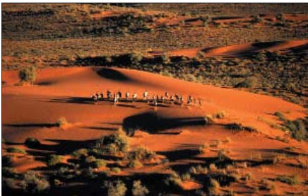
01 - Gemsbock-Herde in der Kalahari.

Die 'Four Deserts Route Namibia' ist etwas ganz Besonderes: sie bringt die Vielfalt der Wüsten zur Geltung, zeigt alternative und nachhaltige Wege der Landnutzung auf, die produktiver sind, mehr Arbeitsplätze schaffen und höhere Einnahmen erzielen als die konventionelle Landwirtschaft. Dabei werden das natürliche Gleichgewicht und die Artenvielfalt der Wüste geschützt oder gar wieder hergestellt.