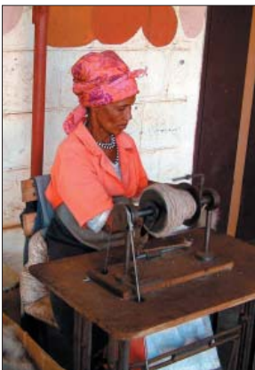
05 - Bei Dordabis in der Kalahari wird Karakulwolle zu Teppichen verarbeitet.

Die Nama Karoo nimmt den größten Teil der südlichen Landesmitte ein: wie ein gewaltiger Keil reicht sie aus Südafrika über den Gariep (Oranje), bis etwa 120 km südlich von Windhoek, und zieht sich dann als schmaler Streifen am Ostrand der Namib entlang nach Angola. Die geologischen Formationen nehmen in Gestalt des Fischfluss Canyons gewaltige Ausmaße an. Es ist der zweitgrößte Canyon der Erde. Er entstand vor rund 130 Millionen Jahren, als der Urkontinent von Gondwana zerbrach. Neben Zwergsträuchern und einzelnen Grasflächen ist der Köcherbaum ein faszinierendes und unübersehbares Symbol des Südens. Beim Wandern und Fahren erhält man