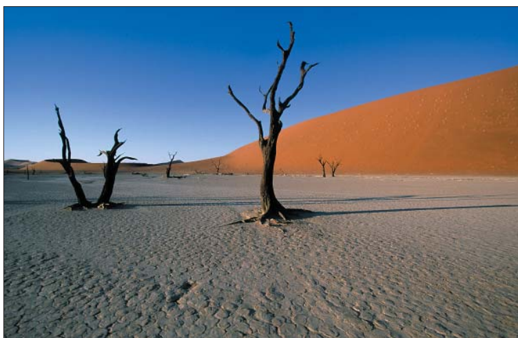
04 - Im Herzen der Namibwüste: Trockene Lehmpanne beim berühmten Sossusvlei.

In diesem Jahr stehen Wüsten weltweit im Rampenlicht, denn die Vereinten Nationen haben 2006 zum 'Internationalen Jahr der Wüsten und Wüstenbildung' erklärt. Dabei geht es um zweierlei: um den Schutz von Wüsten als empfindliche Ökosysteme und um die Eindämmung unnatürlicher Ausbreitung von Wüsten, durch die eine nachhaltige Entwicklung in vielen Gebieten der Erde bedroht wird.