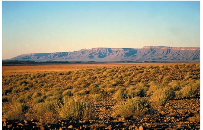
02 - Typische Landschaft der Nama Karoo am Fischfluss Canyon.

Nach Norden zieht sich die Namib Wüste als schmaler Streifen am Atlantik entlang. Im Süden besteht sie aus rötlich leuchtenden Wanderdünen, in der Mitte aus Schotterflächen mit Inselbergen und im Norden aus zerklüfteten blauen Bergen, in die ephemere Flussläufe tiefe Täler geschnitten haben. Nebel versorgen Pflanzen und Tiere mit Feuchtigkeit. Für Besucher gibt es viel zu erleben: man kann früh morgens am Sossusvlei auf die höchsten Dünen der Welt steigen; südlich von Solitaire uralte rote Dünen erkunden, die über Jahrmillionen zu Stein geworden sind; große schwarze Ohrengeräucher beobachten, die am Himmel ihre Kreise ziehen, oder der Spur eines Gamsbocks folgen, der einsam über die Schotterflächen zieht. Ein einzigartiges Erlebnis ist eine Ballonfahrt über das endlose Dünenmeer, wenn es im ersten Morgenlicht rötlich aufleuchtet.