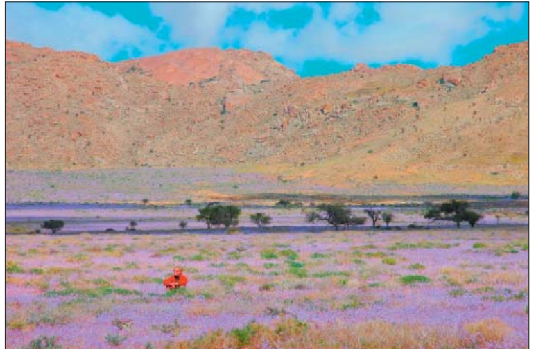
03 - Blühende Wüste: Sukkulenten Karoo bei Aus.

Neben der gängigen Definition, dass eine Wüste ein Trockengebiet ist, muss man sich eine Gegend vorstellen, in der die Verdunstung mindestens zehn Mal höher ist als der dürftige Niederschlag (weniger als 250 mm). Dann bekommt man rasch Respekt vor jedem Lebewesen, das bei solchen Bedingungen existiert. So manchen Besucher mag es überraschen, dass eine Wüste nicht nur aus Sand besteht, sondern auch felsig und bergig sein kann, mit weiten Schotterflächen dazwischen. Sie ist ein Kaleidoskop von faszinierenden geologischen Formen, und die gewaltigen, immer wieder wechselnden Landschaften üben einen Zauber aus, den man sein Leben lang nicht vergisst. Außerdem sind unsere lebenden Wüsten wichtige Zentren der Artenvielfalt. Tiere und Pflanzen haben sich den kargen Bedingungen einfallsreich angepasst. Man kann Extreme von Trockenheit, Hitze und Kälte erleben; Weite und Stille; unglaubliche Sonnenuntergänge und einen mit Sternen übersäten Nachthimmel. Ein Höhepunkt ist auch die Begegnung mit Menschen. Ihre kulturelle und historische Identität ist im Überleben verwurzelt, und sie teilen die Schönheiten ihrer Umwelt gerne mit Besuchern. Ihre Herzlichkeit und Gastfreundschaft macht sie zu idealen Botschaftern der Wüste.